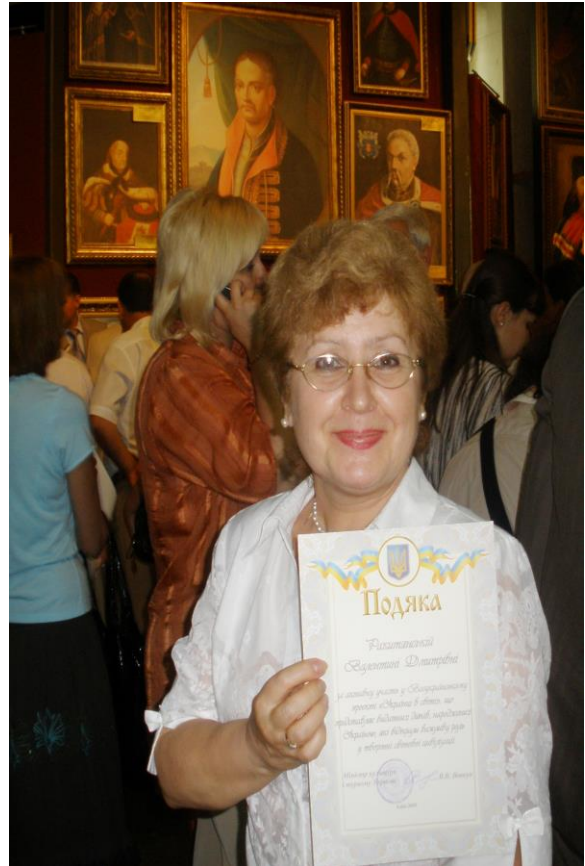
Участь у конференції до річниці проєкту «Українці в світі». Центр ділового і культурного спілкування «Український дім». м. Київ, липень 2009 р.